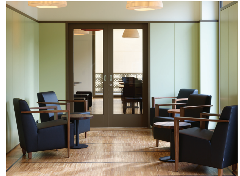
Leselounge bei der Bibliothek