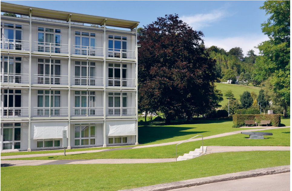
Patientenhaus der Akutpsychiatrie für Erwachsene

Die Privatklinik Clenia Littenheid mit 253 Betten auf 18 Stationen, zwei Tageskliniken in Frauenfeld, den Externen Psychiatrischen Diensten Thurgau in Frauenfeld und Sirnach, einem Ambulatorium für Kinder- und Jugendpsychiatrie und -psychotherapie in Winterthur sowie den ZKJF Zentren für Kind, Jugend und Familie in Frauenfeld, Amriswil und Kreuzlingen gehört zur Privatklinikgruppe Clenia. Clenia zählt zu den renommiertesten und bekanntesten Anbieterinnen für psychiatrische und psychotherapeutische Leistungen in der Schweiz und nimmt für mehrere Kantone Grundversorgungsaufträge wahr.