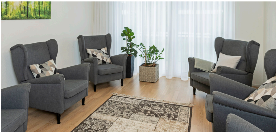
Alterstagesklinik im Psychiatriezentrum Clenia Frauenfeld