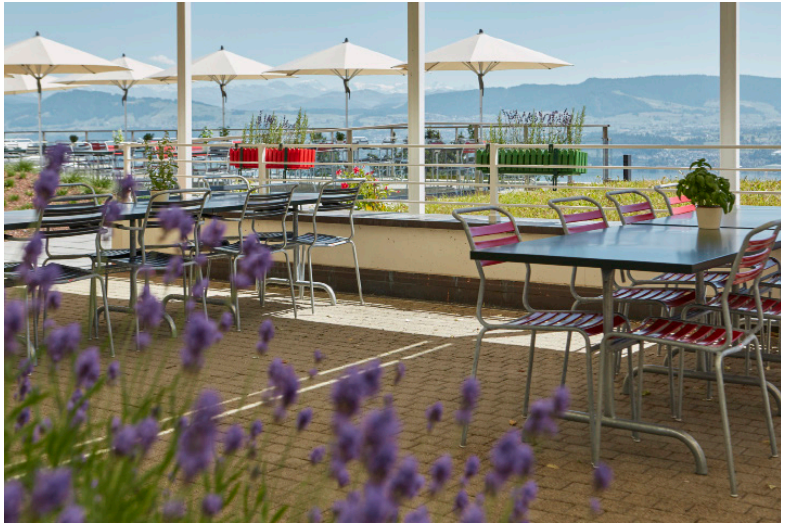
Terrasse des Clenia Bergheims in Uetikon am See.